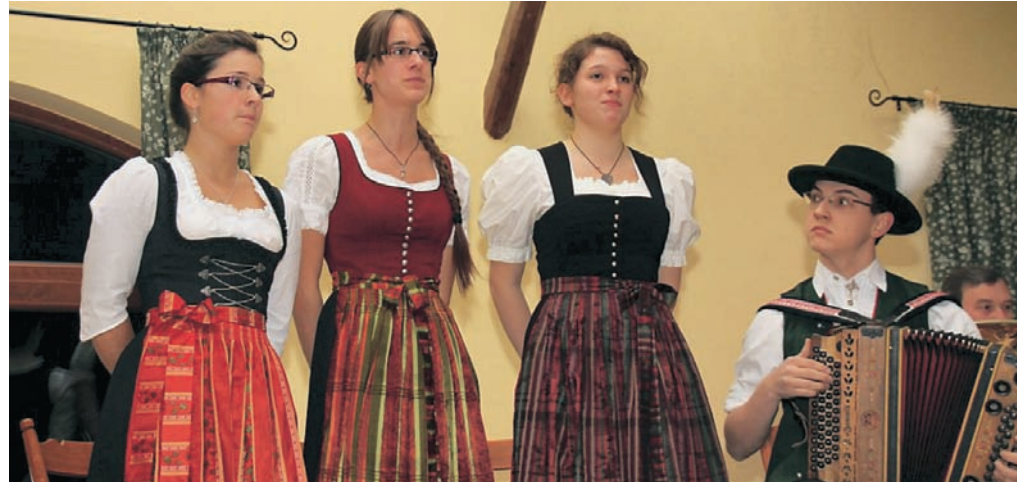
Die Mitglieder des „Altöttinger Dreigsangs“ kommen aus ganz verschiedenen Ecken Oberbayerns, besuchen jedoch dieselbe Schule am Altöttinger Kapellplatz.