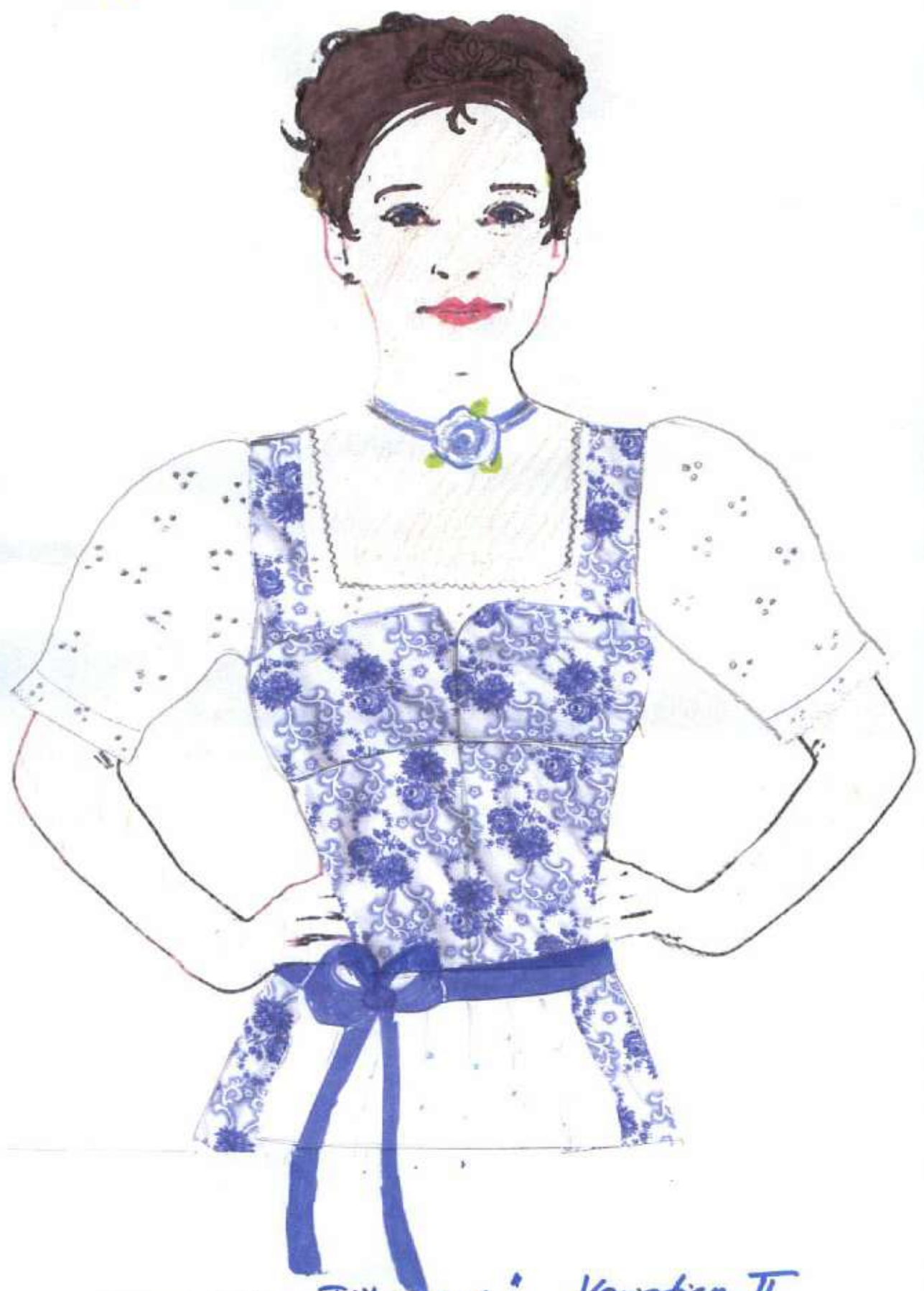
So heißt mein Modell: "Föhnwind" Variation II